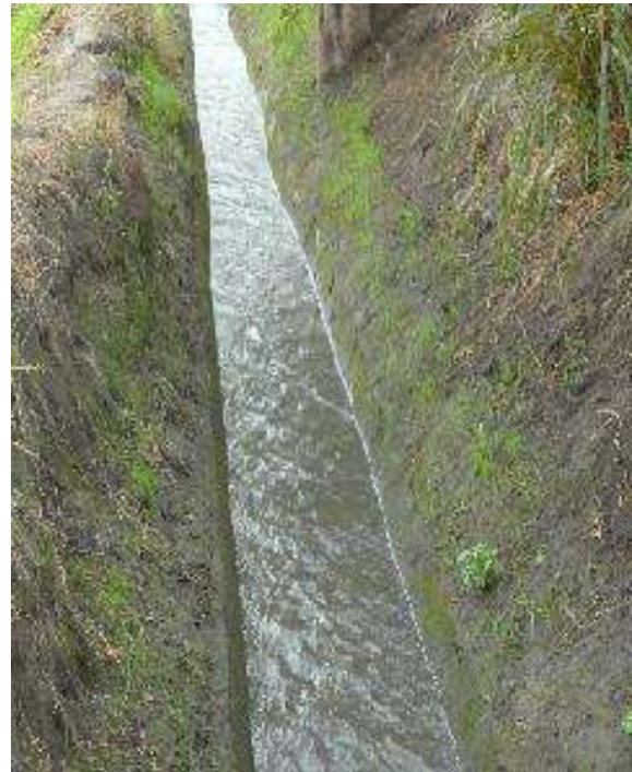
Estructura de distribución