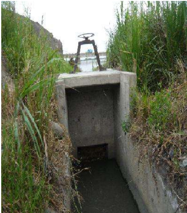
Estructura de control