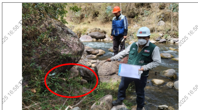
Fotografía N° 02. Punto de Vertimiento V-01, que llega al río Trapiche en la margen derecha F:10.10.2024.