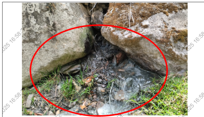
Fotografía N° 03. Punto de Vertimiento V-02, que llega al río Trapiche en la margen derecha F:10.10.2024.