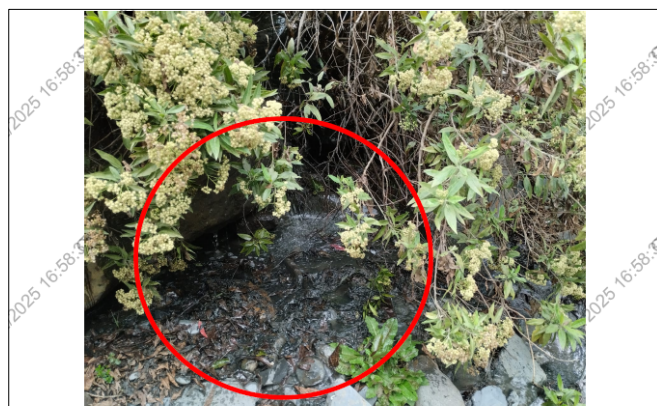
Fotografía N° 05. Punto de Vertimiento V-03, que llega al río Amparaes en la margen izquierda F:10.10.2024.