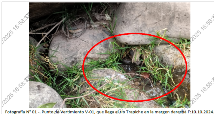
Fotografía N° 01 -. Punto de Vertimiento V-01, que llega al río Trapiche en la margen derecha F:10.10.2024.