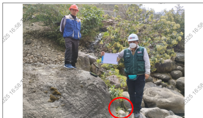
Fotografía N° 04. Punto de Vertimiento V-02, que llega al río Trapiche en la margen derecha F:10.10.2024.