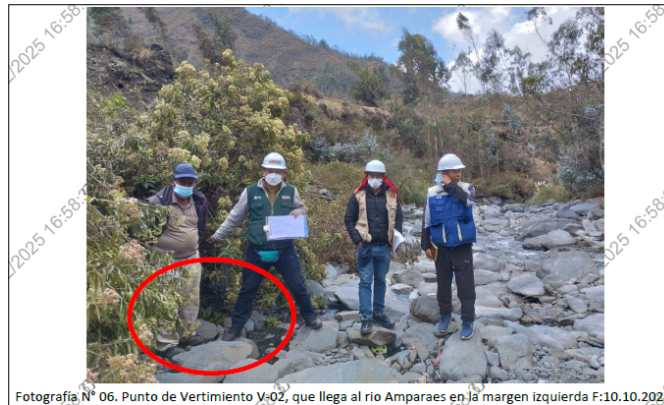
Fotografía N° 06. Punto de Vertimiento V-02, que llega al río Amparaes en la margen izquierda F:10.10.2024