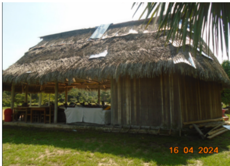
Figura 1. Construcción tipo local campestre (local de machimbrado).