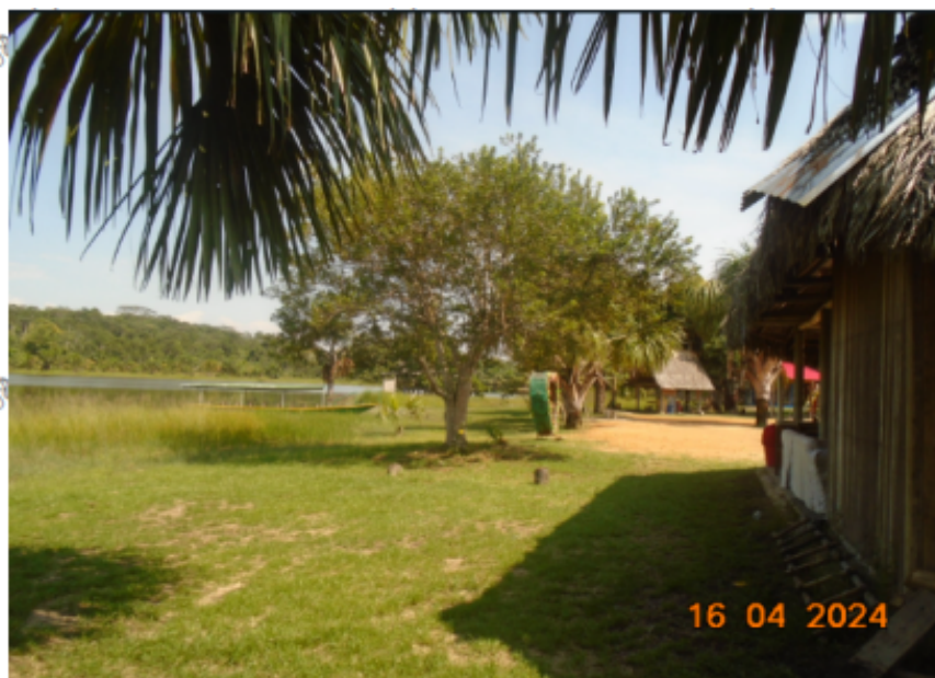
Figura 2. Local campestre ocupando el cauce y la faja marginal de la laguna de los milagros.