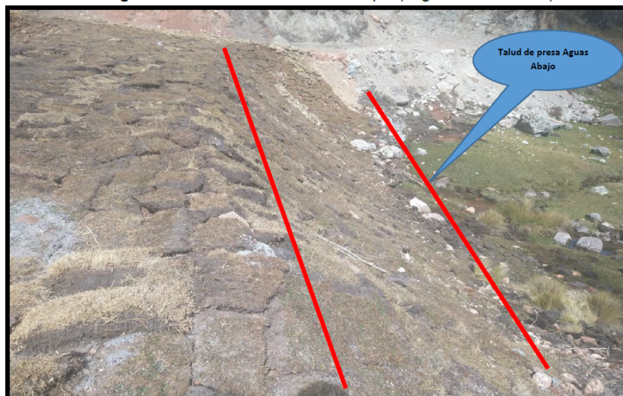
Fotografía N°02: Altura de Presa del dique (Laguna Yanahuarmi)