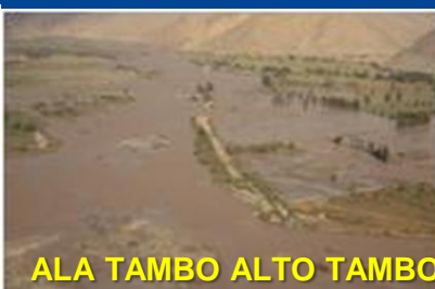
ALA TAMBO ALTO TAMBO