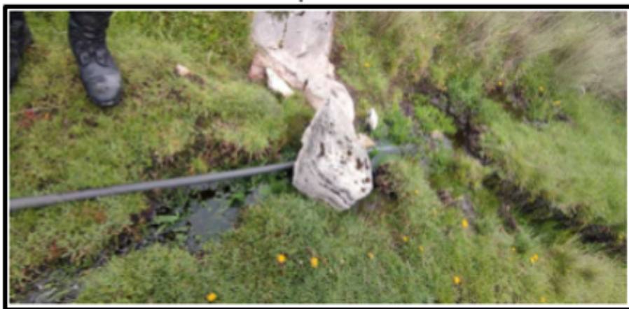
Fotografía N° 04: Se observa la tubería de 1" que conduce el agua desde la captación