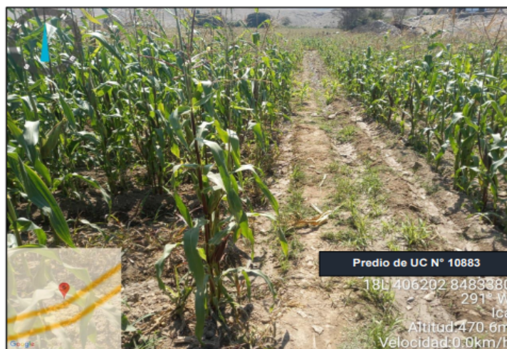
Fotografía N° 1. Cultivo de maíz choclo del predio de UC N° 10883