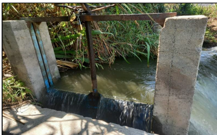
Fotografía del Informe Técnico N° 0045-2022-ANA-AAA.CHCH-ALA.P/LCDL (, donde se muestra la compuerta levantada)