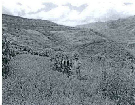
FOTOGRAFIA N° 03: PLANTACIONES DE PALTA EN EL PREDIO "EL GUABO".