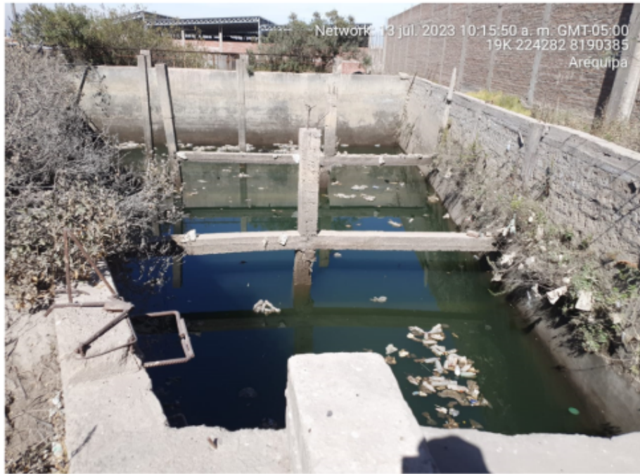
Anexo N° 03: Reservorio de agua de cemento tipo trapezoidal de la empresa NELANA S.A.C.

FOTOS DE LOS ANEXOS DE LA NOTIFICACIÓN N° 0002-2024-ANA-AAA.CO-ALA.CH