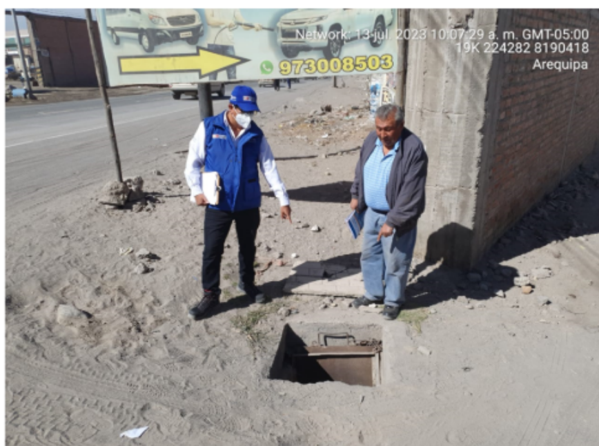
Anexo N° 02: Punto de captación de agua superficial en 1P de la empresa NELANA S.A.C.