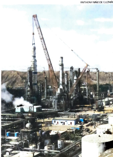
En total, 25 funcionarios fueron removidos del cargo que ocupaban.